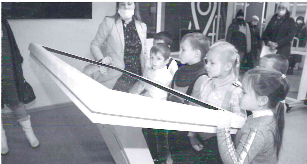
Воспитанники детсада «Гармония» в мастерской «Организация экскурсионных услуг»