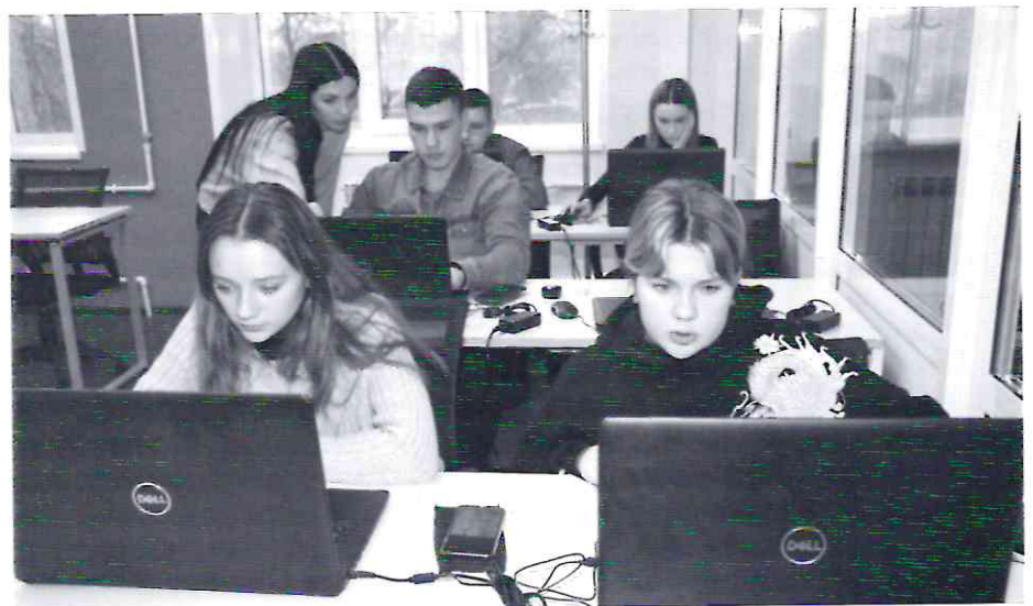
Школьники в мастерских

А уже через несколько дней в новые, красивые, еще пахнущие краской и свежей мебелью мастерские пришли первые посетители. 30 учителей общеобразовательных школ Нижнего Тагила осваивали программу повышения квалификации «Особенности подготовки конкурсантов к чемпионатам WorldSkills Russia». Открытие модернизированных учебных мастерских