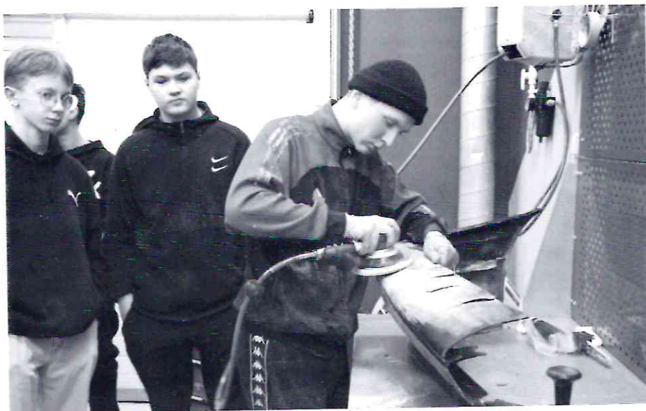
Школьники в мастерских

Последние три года стали просто прорывными для среднего профессионального образования. В колледжах и техникумах России за это время открылись около 1500 современных мастерских по направлениям: искусство, дизайн и сфера услуг, строительство, информационно-коммуникационные технологии, обслуживание транспорта и логистика, промышленные и инженерные технологии, сельское хозяйство и социальная сфера. На модернизацию профессионального образования государство выделило более 11 миллиардов рублей. Всего к 2024 году планируется создать 5000 мастерских.