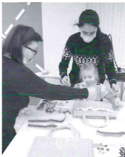
Юные мастерицы осваивают технологии моды