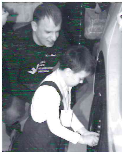
Воспитанники детсада «Гармония» в мастерской по ремонту автомобилей

Автомобильное оборудование, ноутбуки и интерактивные панели отдохнули от студенческого гомона только в новогодние праздники. Уже 10 января мастерские вновь заполнили студенты и преподаватели для того, чтобы готовиться к очередному чемпионату «Молодые профессионалы», который пройдет в Свердловской области уже в феврале. Они пообещали, что отработают на конкурсе на совесть, как говорится, мастерски. Пусть у них все получится!