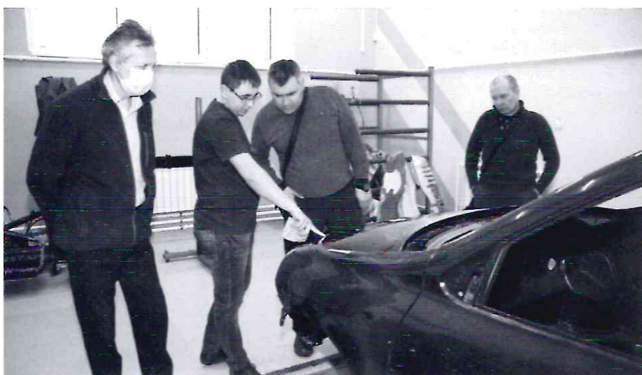
Педагоги школ в мастерских

Наиболее любознательными и эмоциональными оказались самые маленькие гости новых демидовских мастерских – воспитанники детского сада «Гармония». Малыши не побоялись ни декабря мороза, ни дальней дороги (с Северного поселка путь неблизкий) и вместе со своими мамами и воспитателями совершили большое путешествие