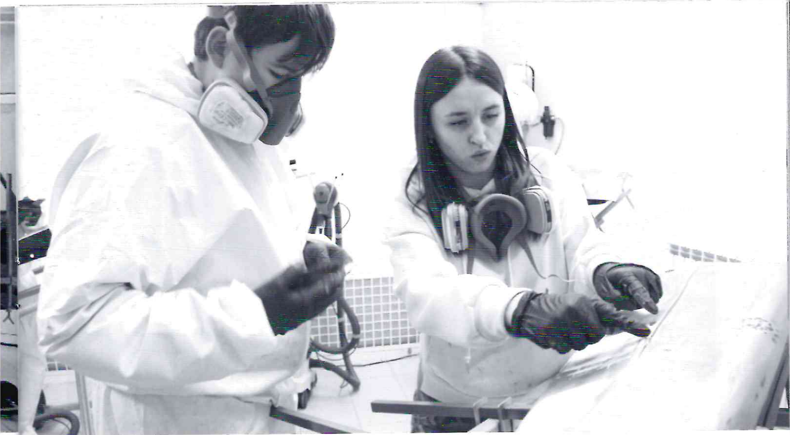
Подготовка к профессиональному конкурсу

В Свердловской области – более 100 колледжей и техникумов, в которых обучаются свыше 120 тысяч студентов. Каждый год почти 30 тысяч выпускников среднего профессионального образования вливаются в ряды молодых рабочих и служащих предприятий не только нашей области, но и всей России. Для студентов СПО и их преподавателей уже сформирована сеть из 159 мастерских и центров проведения демонстрационных экзаменов.