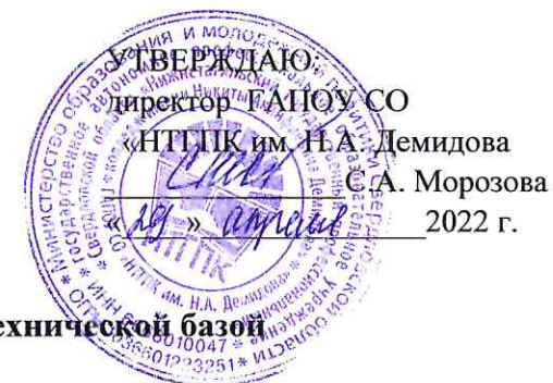
График загрузки мастерской, оснащенной современной материально-технической базой по компетенции «Окраска автомобиля» на май 2022 г.