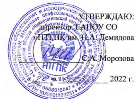
График загрузки мастерской, оснащенной современной материально-технической базой по компетенции «Экспедирование грузов» ноябрь 2022 г.