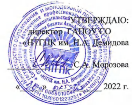
График загрузки мастерской, оснащенной современной материально-технической базой по компетенции «Окраска автомобиля» ноябрь 2022 г.